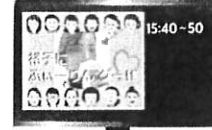
裕子にふいーりん・グー!!

15:10~15:25 東京・千葉チームからのコーナーとなります。だだだ星人って?! zoomを使った面白ゲーム! 止みつきになるかも・・・?