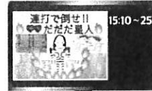
連打で倒せ!! vs だだだ星人

14:45~15:00 東京・千葉チームからのコーナーとなります。クイズに答えて早打ち名人は誰だ?!楽しい色彩クイズもお楽しみ!