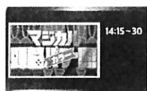
マジカル頭脳 カラー!!!!

14:15~14:30 関西・中部チームからのコーナーとなります。マ・ジ・カ・ル・カ・ラア〜♪ カラーカード又は赤・黄・緑・青の折り紙がある方はご準備下さい。