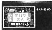
早打ち名人バトル

14:30~14:45 埼玉・神奈川チームからのコーナーとなります。 お家の中でできるカラフルな借り物競争です♪カラフルな等賞は誰の手に?